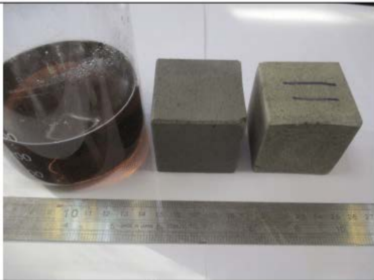
تصویر نمونه بعد از آزمون